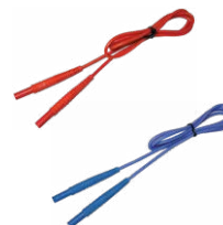
Przewód 1,2 m (wtyki bananowe) czerwony / niebieski