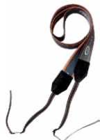
Szelki do mier- nika (typ M-1)