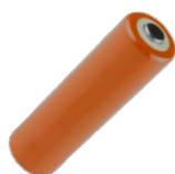
4x bateria LR6 1,5 V