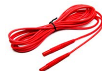
Przewód do pomiaru pętli zwarcia (wtyki bananowe) 5 m / 10 m / 20 m