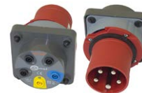
Adapter gniazd trójfazowych 63 A